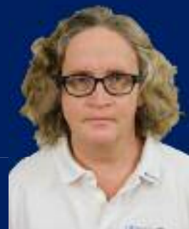
Ihre persönliche Betreuung

Betreuung KÜRZL Personen Haus Garten Grab