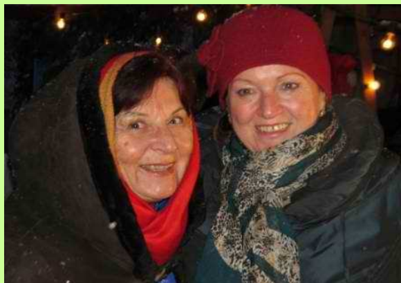
Advent in Hallstatt