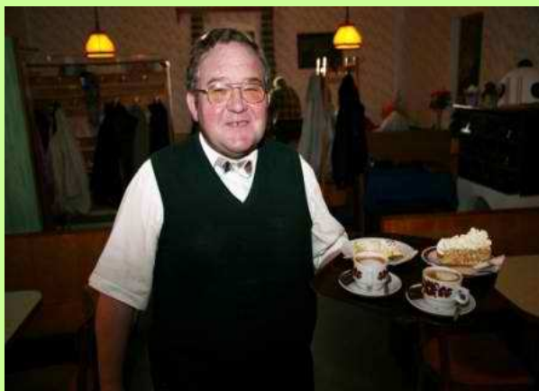
Auf der Mostalm

– AKTIV – VITAL – FRÖHLICH – GESELLIG – UNTERNEHMUNGSLUSTIG – FIT – INTERESSIERT –