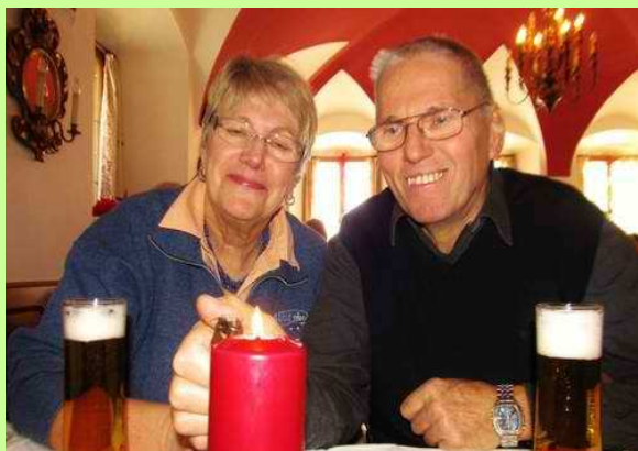
Advent in Salzburg